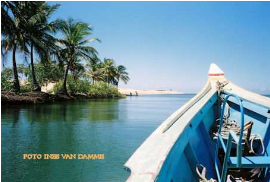
De monding van de San Francisco rivier

Het verwondert me dat Procopio geen enkele aandacht besteedt aan honden die de Portugezen zonder twijfel bezaten vanaf het moment van kolonisatie van Pernambuco half 1500. De Portugezen hadden zich vooral toegelegd op de suikerrietcultuur en de suikerproductie in de grote engenhos (suikerfabrieken) en op de veeteelt in Bahia en Paraiba. Verschillende Nederlandse kroniekschrijvers uit de W.I.C. tijd meldden af en toe iets over honden die de Portugezen toebehoorden als dit van belang was, b.v. alarm slaan van de Portugese honden bij een besluiping door Nederlandse soldaten.