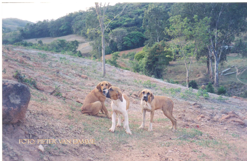
De Fila Brasileiro in Minas Gerais

De auteur geeft toestemming voor het – enkel in zijn geheel - plaatsen van dit artikel op informatieve websites