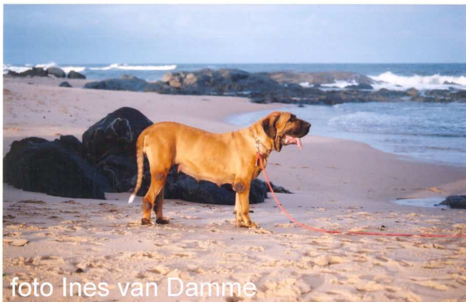
Fila op het strand van Itapua – Bahia, nakomeling van de vele honden die per schip over de Atlantische Oceaan in deze provincie arriveerden

Daar de schepen uit Europa in die tijd meestal honden aan boord hadden is het zeer waarschijnlijk dat er in de zeer vroege tijden van de Braziliaanse periode wel eens een exemplaar achterbleef. Ongeveer half zestiende eeuw werd de kolonisatie pas serieus aangepakt en vestigden Portugezen zich in de verschillende “capitanias” zoals Pernambuco en Salvador in het Noord Oosten en Santos in het Zuiden (ter hoogte van het huidige Sao Paulo). Vanaf die periode werd er regelmatig vee geïmporteerd en men kan stellen dat bij ieder veetransport honden meereisden. Dit waren Iberische honden die in staat waren het vee te domineren.