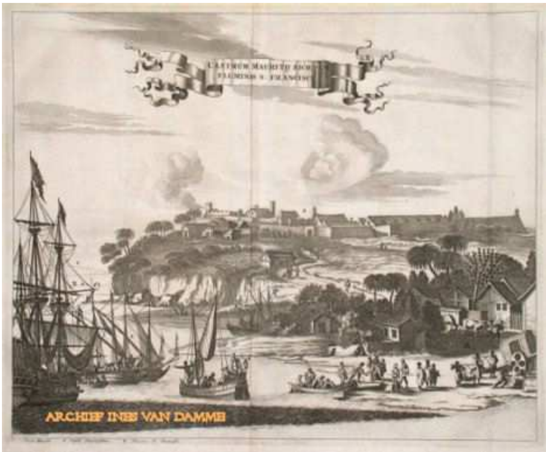
Penedo aan de San Francisco rivier ten tijde van de bezetting door Maurits van Nassau

De Nederlander kwam naar Brazilië voor de handel, niet om de handen vuil te maken.